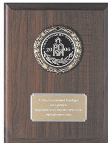
Zlatá medaile z mezinárodní výstavy INTERCHARM 2006 Moskva